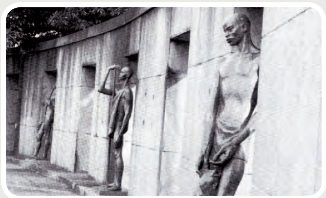
Monument à Stanley, 1956, Kinshasa.