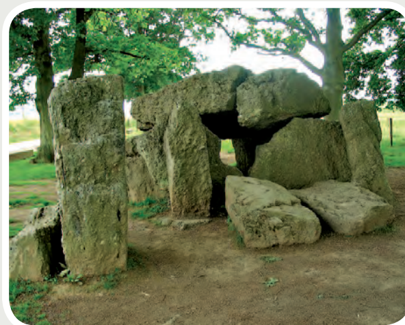
Allée couverte de Wéris I, vers 3000-2800 av. J.-C.